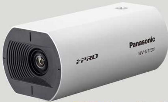
屋内対応 バリフォーカルレンズ フルHD: WV-U1134J / HD: WV-U1114J