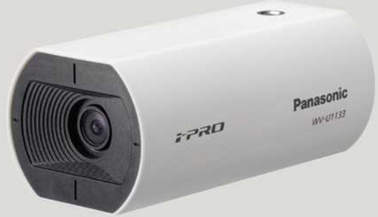
屋内対応 固定焦点レンズ フルHD: WV-U1133J / HD: WV-U1113J