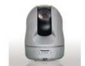
卓上に置いて多彩な用途に

天井直付け設置のほか、別売りの取付金具を使用することで天井埋込や壁取付など、環境にあわせた多彩な設置をおこなえます。また、会議用途など、卓上機器として簡易的に使用することができます。