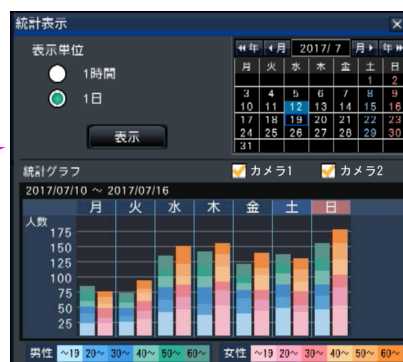
画面イメージ：統計データグラフ表示