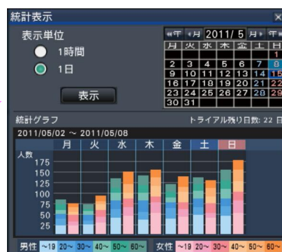
画面イメージ：統計データグラフ表示