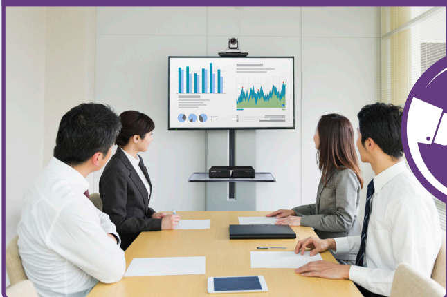
ビデオ会議 HDコム (社内)